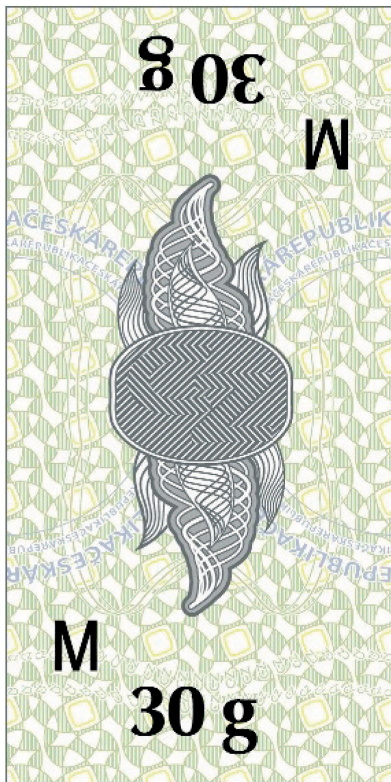
Vzor č. 3: Tabáková nálepka pro jednotkové balení tabáku ke kouření